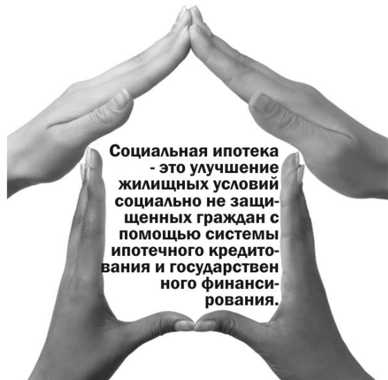
Социальная ипотека - это улучшение жилищных условий социально не защищенных граждан с помощью системы ипотечного кредитования и государственного финансирования.

Решение о включении молодой семьи в список претендентов на получение субсидии (этот единый по всей стране список формируется в Роструде) принимают органы исполнительной власти субъекта РФ и передают эти данные в Роструст.