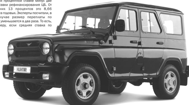
UAZ Hunter (Хантер)

В список из 30 автомобилей-льготников, стоимость которых не превышает 350 тысяч рублей, вошли нелюксовые марки - весь модельный ряд АвтоВАЗа, UAZ Hunter, а также Ford Focus, Fiat Albea, Kia Spectra, Renault Logan, Skoda Fabia и Volkswagen Jetta.