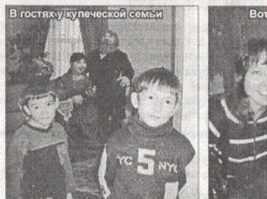
В гостях у купеческой семьи