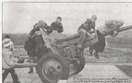
Весело на мирной пушке