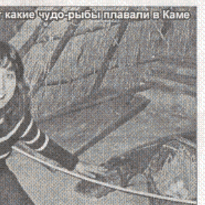
Вот какие чудо-рыбы плавали в Каме