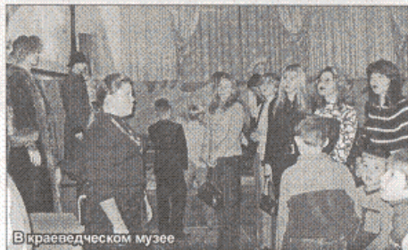
В краеведческом музее

Участники экскурсии не просто остались довольны путешествием, а единодушно отметили, что такие поездки весьма полезны: и кругозор расширяют, и хорошим настроением заряжают.