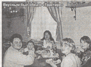
Вкусным был обед в «Трактире»